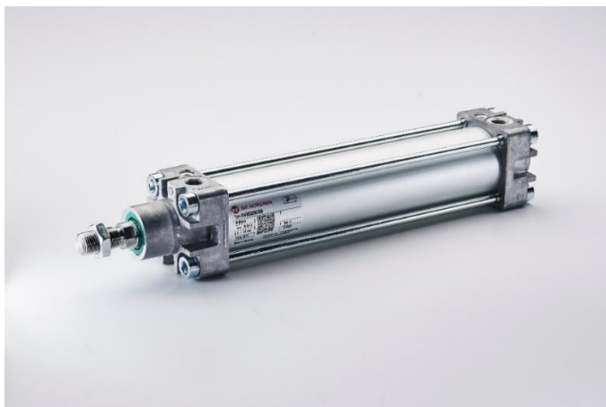
Bildunterschrift 2: Pneumatischer Aktuator von IMI Precision Engineering.