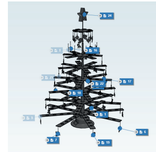
3D Modell mit HotSpots

Füllen Sie das Upload-Formular unter „Hochladen“ aus und hängen Sie Ihr 3D Modell in einem geeigneten Format (STL, STEP, DAE, 3DS, OBJ, CIP) an. Dann bestätigen Sie mit dem Button „Hochladen“.